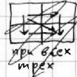
при всех трех